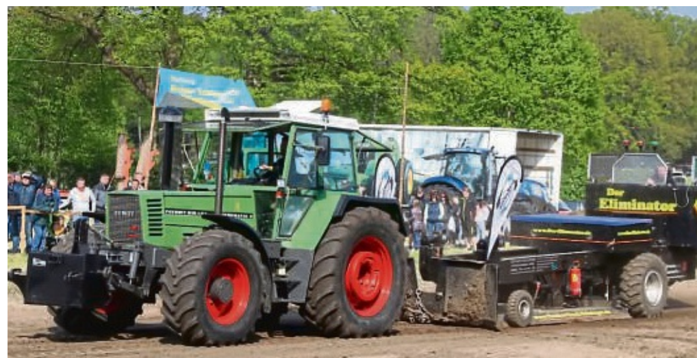
Mehr als 100 Teilnehmer sind mit ihren Traktoren gegeneinander angetreten.

Am Dienstag kamen zahlreiche Jugendliche aus Nah und Fern, um fröhlich in den Mai zu feiern. Nach Angaben des Fördervereins der Freiwilligen Feuerwehr Bötenberg, der als Veranstalter fungierte, gab es noch einmal mehr Besucher als im Vorjahr.